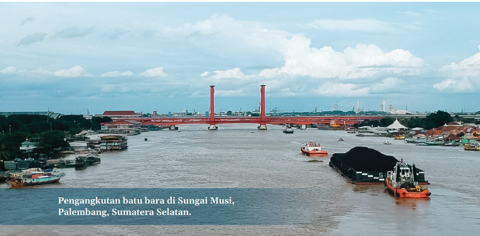
Pengangkutan batu bara di Sungai Musi, Palembang, Sumatera Selatan.