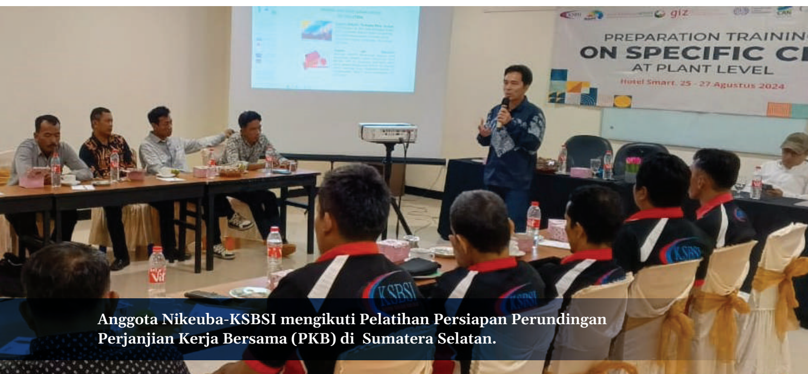
Anggota Nikeuba-KSBSI mengikuti Pelatihan Persiapan Perundingan Perjanjian Kerja Bersama (PKB) di Sumatera Selatan.