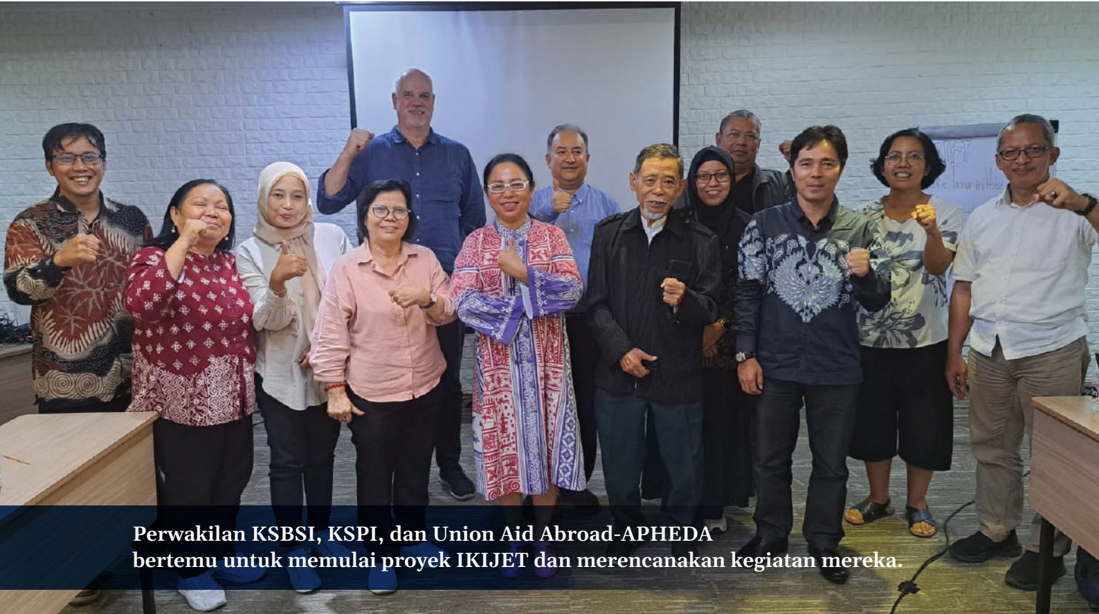
Perwakilan KSBSI, KSPI, dan Union Aid Abroad-APHEDA bertemu untuk memulai proyek IKIJET dan merencanakan kegiatan mereka.

Serikat buruh memiliki peran kunci dalam memastikan transisi menuju ekonomi rendah karbon berlangsung secara adil, inklusif, dan berpihak pada kepentingan buruh serta masyarakat. Transisi berkeadilan tidak akan terwujud tanpa keterlibatan aktif serikat buruh sebagai representasi sah pekerja, baik dalam proses perencanaan, pelaksanaan, maupun advokasi kebijakan yang padu. Peran-peran itu termasuk: