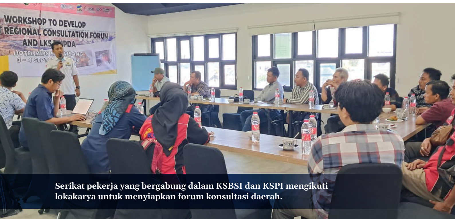
Serikat pekerja yang bergabung dalam KSBSI dan KSPI mengikuti lokakarya untuk menyiapkan forum konsultasi daerah.