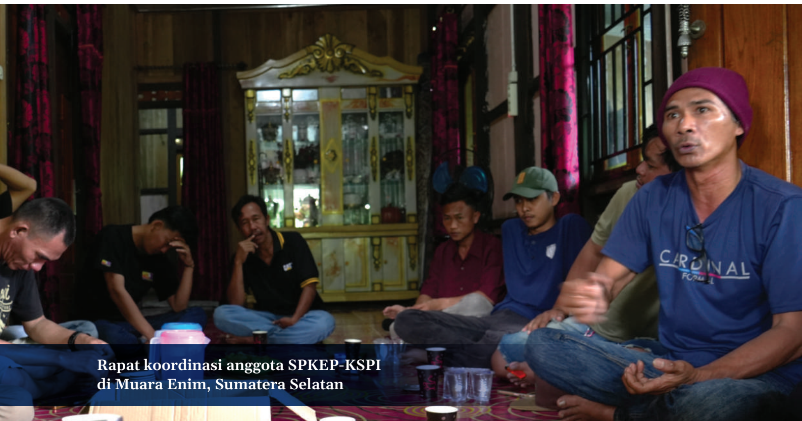
Rapat koordinasi anggota SPKEP-KSPI di Muara Enim, Sumatera Selatan

Sebelum merencanakan dan memulai strategi transisi berkeadilan, serikat buruh penting untuk mengenali kondisi spesifik wilayah dan memahami kebutuhan serta prioritas buruh dan masyarakat terdampak. Penilaian kebutuhan yang baik akan memastikan strategi serikat buruh didasarkan pada fakta dan data yang sebenarnya di lapangan. Strategi ini juga harus mencakup semua pihak dan sesuai dengan realitas setempat.