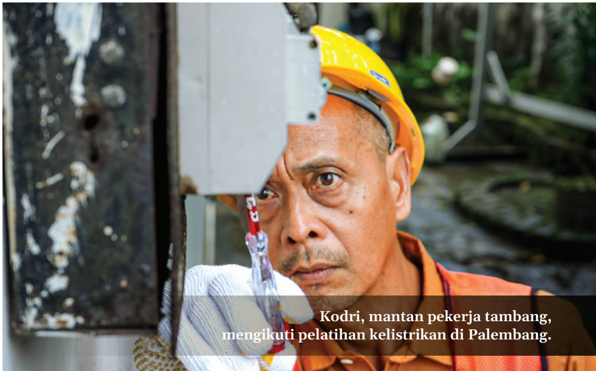
Kodri, mantan pekerja tambang, mengikuti pelatihan kelistrikan di Palembang.