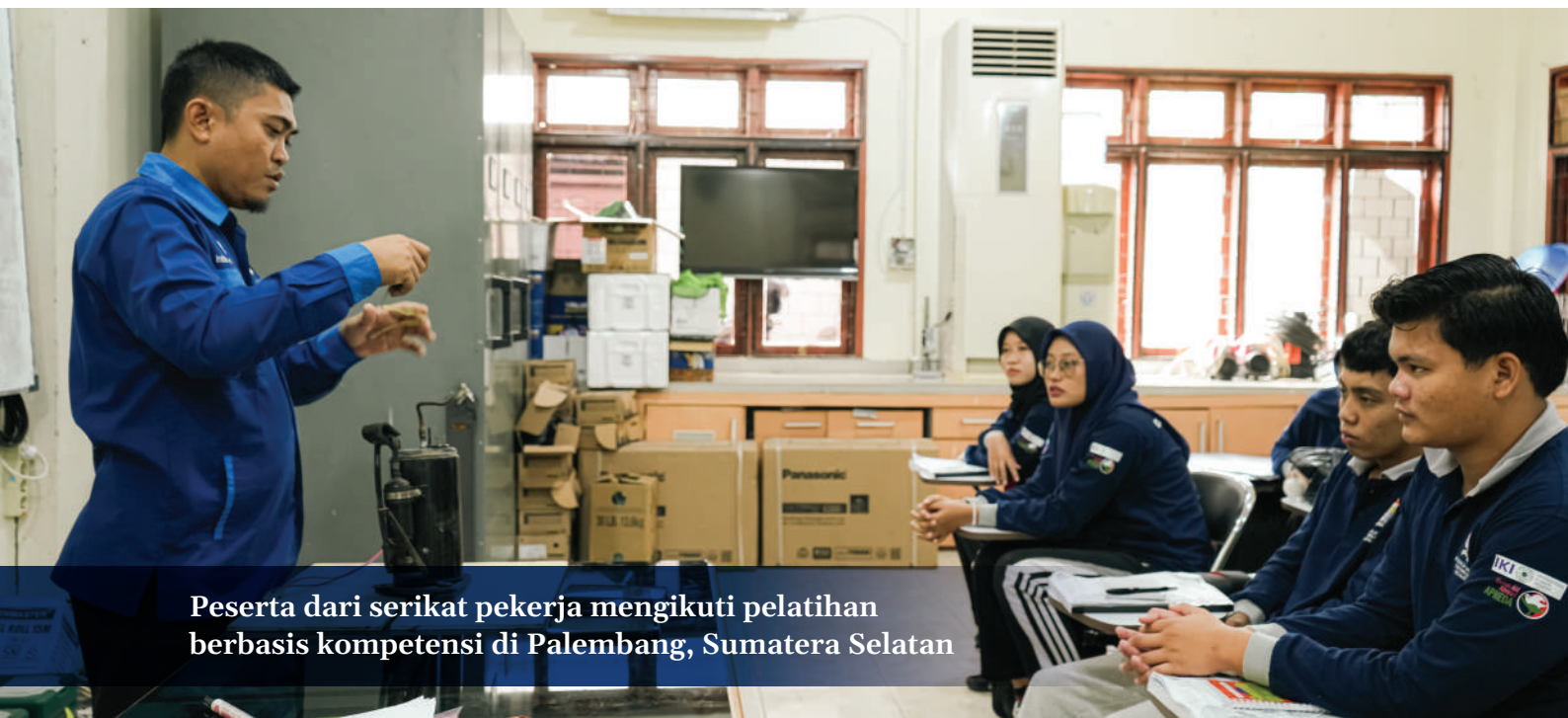
Peserta dari serikat pekerja mengikuti pelatihan berbasis kompetensi di Palembang, Sumatera Selatan

Pada 2025, Indonesia menyampaikan NDC kedua yang memuat rencana mitigasi terbaru untuk mengerem pemanasan global serta menetapkan target penurunan emisi yang baru. Kemampuan Indonesia untuk mencapai target tersebut bergantung pada upaya dalam negeri sekaligus dukungan internasional.